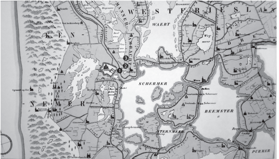
Deel van de kaart van het zogenaamde Noorderkwartier, zoals het er in de zestiende eeuw uitgezien moet hebben. Duidelijk is te zien dat Graft op een eiland lag tussen de Schermer en de Beemster.