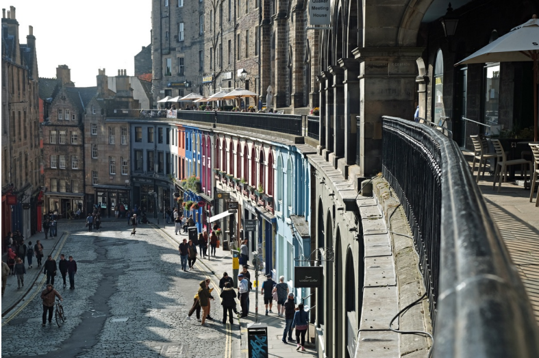
Edinburgh zit vol prachtige straatjes, zoals Victoria Street

Deze eerste wandeling voert langs klassieke spots in de oude binnenstad. Plekken die je niet kan missen en dingen die gemakkelijker over het hoofd te zien zijn. De Royal Mile beslaat de straten tussen Edinburgh Castle en Palace of Holyroodhouse : van het huis van de historische koningen naar het verblijf van de huidige koningin. Edinburgh Castle ligt midden in het toeristische hart van Edinburgh. Door de ligging op een heuvel is het vanaf veel plekken in de stad te zien en gemakkelijk als coördinatiepunt te gebruiken.