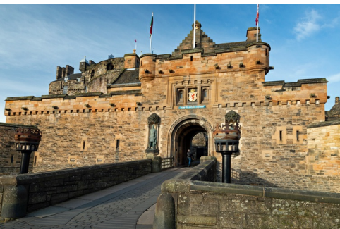
De toegang tot Edinburgh Castle.

Weinig toeristen verlaten Edinburgh zonder een bezoek aan het wereldberoemde Edinburgh Castle 1 te hebben gebracht. Met zo'n 2,1 miljoen bezoekers per jaar is het de populairste toeristische attractie in Schotland. Het kasteel biedt de optie om entreetickets vooraf online te kopen, zodat je niet in een lange rij hoeft te staan. Extra fijn als het regent én de kaartjes zijn goedkoper als je ze online bestelt.