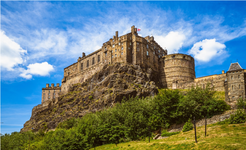
Edinburgh Castle, de blikvanger van de stad.