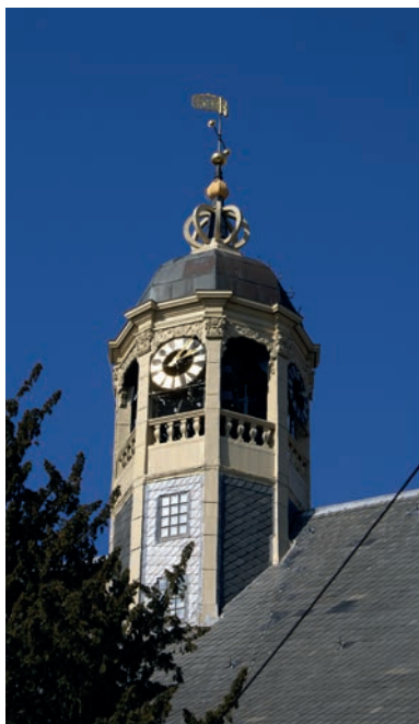
De koepel op de grote kerk of Martini-kerk waar het carillon in hangt, is gemaakt in 1772 in opdracht van de magistraat en vroedschap en het werk was gegund aan een schepen en twee leden van de vroedschap.

vroedschap en van stad tot stad wisselden de regels met betrekking tot de keuze van de vroedschapsleden, hoe ze gekozen werden en waaraan ze moesten voldoen. Tevens verschilde per stad het aantal vroedsmannen en het aantal leden van de magistraat. In Friesland gold een 'republikeinse staatsregeling waarbij elke stad volledig autonoom op haar gebied was'. 10