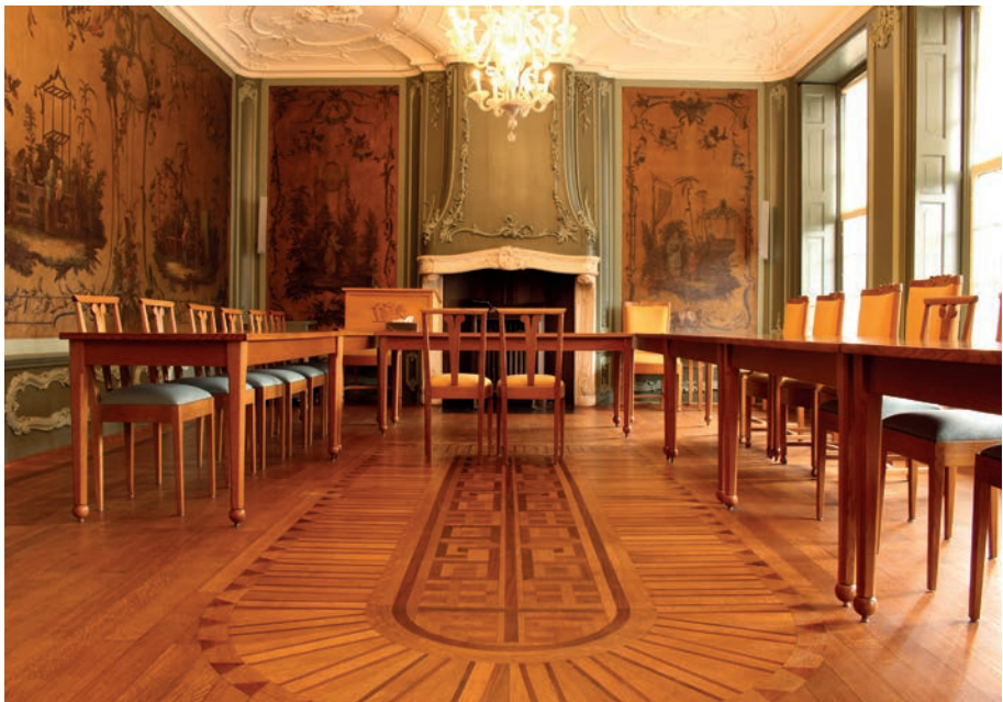
De vroedschapszaal is nu de trouwzaal in het gemeentehuis en kwam gereed in 1762. 5