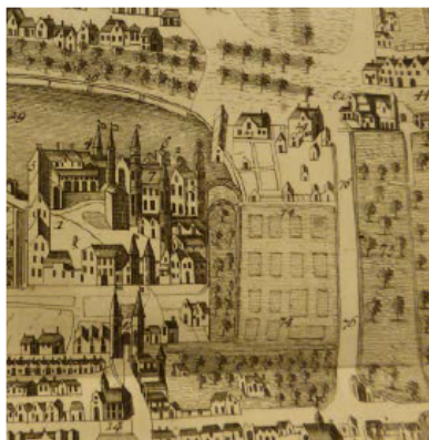
Detail kaart met het Plein in 1570

Een kaart uit 1570 laat zien dat dit deel van Den Haag nog nauwelijks bewoond was.