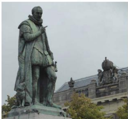
Willem van Oranje, met op de achtergrond het 'Logement van Amsterdam'.

In het midden van het Plein staat het standbeeld van Willem van Oranje, de 'Vader des Vaderlands' of 'stichter van Nederland'. Met zijn linkerhand op de documenten van het verbond tegen de Spanjaarden en aan zijn voeten zijn trouwe hond. Tegenwoordig staart hij naar de hoge gebouwen van de ministeries.