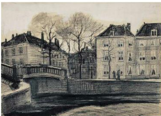
Vincent van Gogh; Brug en huizen op de hoek Herengracht-Prinsessegracht (1882); Van Gogh Museum, Amsterdam (Vincent van Gogh Stichting).

We beginnen onze wandeling in de voetstappen van de schilder Vincent van Gogh. Hij stond hier aan de Prinsessegracht in het gras naast de brug, tegenover de Herengracht , met zijn schetsboek of zijn ezel. Zoals we kunnen zien op de tekening die hij in 1882 maakte.