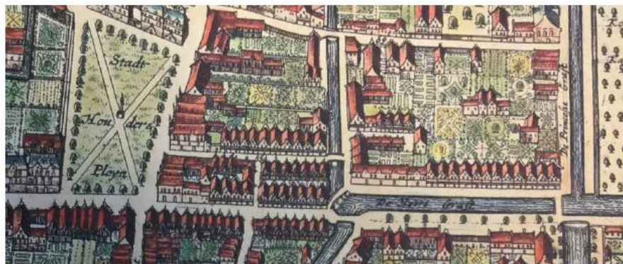
We volgen de Herengracht en de Korte Poten naar het Plein.

Op de veel oudere kaart was dit een deel van de gracht die de stad omsloot (rechtsonder).