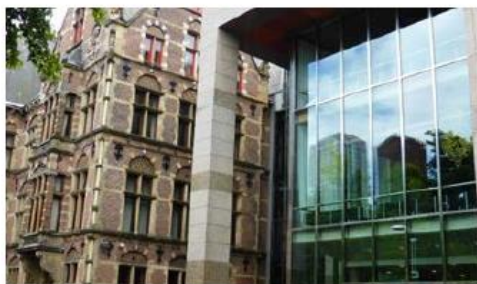
Oud en nieuw deel van het parlamentsgebouw.

Aan de westkant van het Plein zijn '... de gerechtshoven, waar iemand die plat Nederlands verstaat een verloren uurtje door kan brengen met het luisteren naar de pleidooien en het observeren van de rechtsgang in de praktijk.' 1743NN