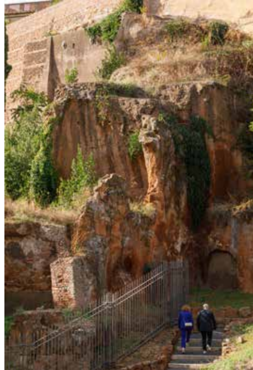
Piazza della Consolazione • De rode steile wand van de Tarpeïsche rots is duidelijk zichtbaar. Langs deze kant van de Capitool-heuvel slopen de Galliërs omhoog.

Vestaalse maagden zochten een veilig heenkomen. Zij waren verantwoordelijk voor de cultus van Vesta, die zelfs draaide om de continuïteit van Rome. Dat zelfs deze priesteressen huis en haard verlieten, betekende dat de situatie echt dramatisch was. Rome werd bedreigd in haar voortbestaan.