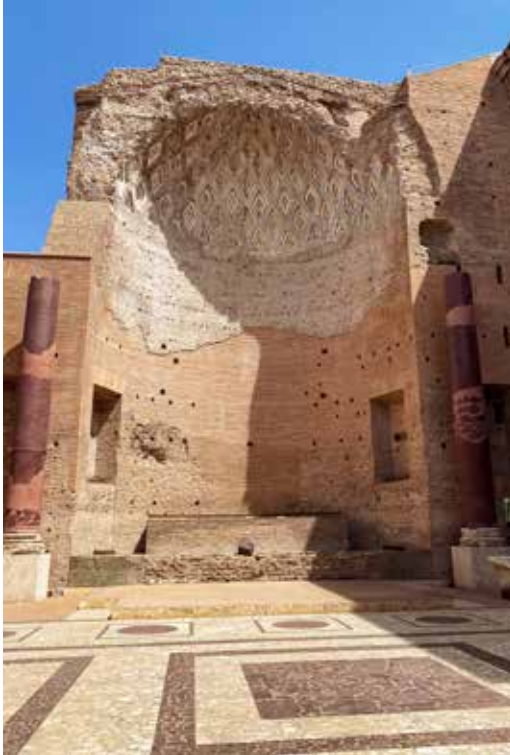
Forum Romanum • De cella van de tempel van de godin Roma Aeterna de andere kant was voor de Venus.