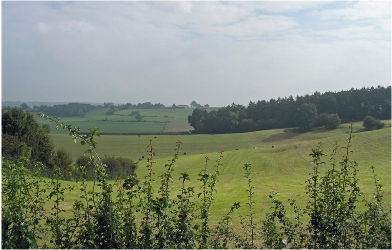
Glooiend landschap met beboste hellingen

De Voerstreek is amper 50 km 2 groot en telt ruim 4100 inwoners. Toch vormt de Voerstreek een lappendeken van landschappen. Van de Maasterrassen van het Maasland in het westen via de glooiende heuvels van het Land van Herve in het zuidoosten naar het kalkrijke heuvellandschap op de grens met Nederlands Limburg. Akkers liggen op de vlakke toppen van de heuvels, op de hellingen overheersen bossen en, meer naar de dalbodem toe, weilanden. In het dal van de Voer vind je de drie 'Voer'-dorpen: 's-Gravenvoeren, Sint-Martens-Voeren en Sint-Pieters-Voeren. De drie andere dorpen – Moelingen, Teuven en Remersdaal – liggen verspreid binnen de gemeente.