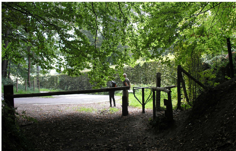
Door het sjiegelke (draaipootje)

Het Voerense heuvelland is een ideale streek voor rustzoekers, wandelaars en fietsers. De dorpen beschikken over een ruim aanbod van hotels, gastenkamers (B&B's), vakantiewoningen, restaurants en een modern bezoekerscentrum. Wandelroutes slingeren door de bossen, over onverharde paden en door holle wegen via knooppunten. Verschillende tracés lopen de heuvels in, door droogdalen, langs vierkanthoeven, bossen en boomgaarden.