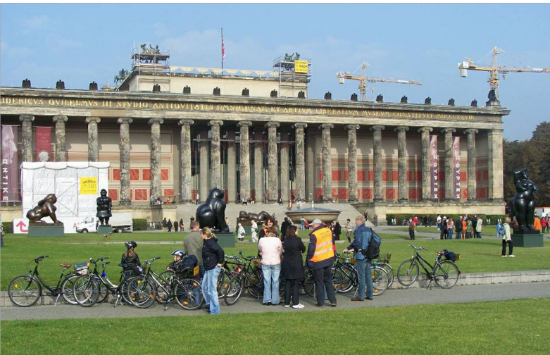
Fietsers bij het Altes Museum aan het Schloßplatz

Deze gids is geschreven als aanvulling op de standaard-reisgidsen. Grote toeristische attracties zullen niet of alleen kort worden genoemd. Neem dus zelf een goede reisgids mee en ook een plattegrond van de stad. In de routebeschrijvingen is vooral aandacht voor zaken die in de meeste reisgidsen niet aan bod komen.