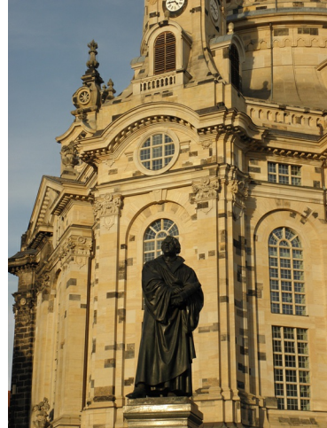
Luther voor de Frauenkirche