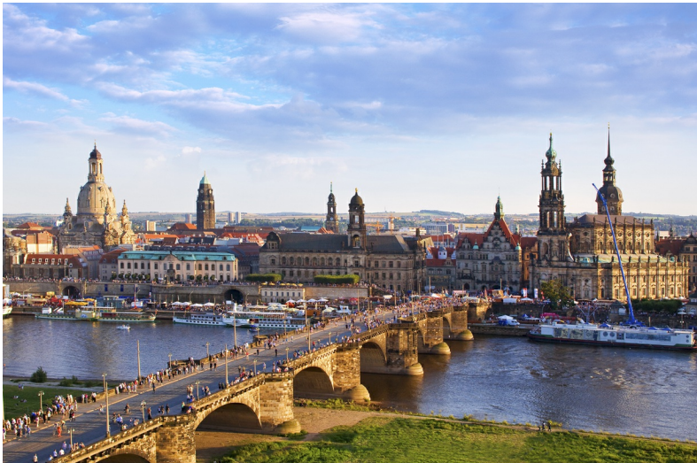
Zicht op Altstadt met vooraan de Augustusbrücke.

Omdat Dresden de hoofdstad van de deelstaat Saksen is, heeft de stad ook een bestuursfunctie met de daarbij horende overheidsgebouwen. Sommige zijn heel modern, zoals de Landtag , het Saksische parlement, op de linker Elbeoever tussen de Augustusbrücke en de Marienbrücke.