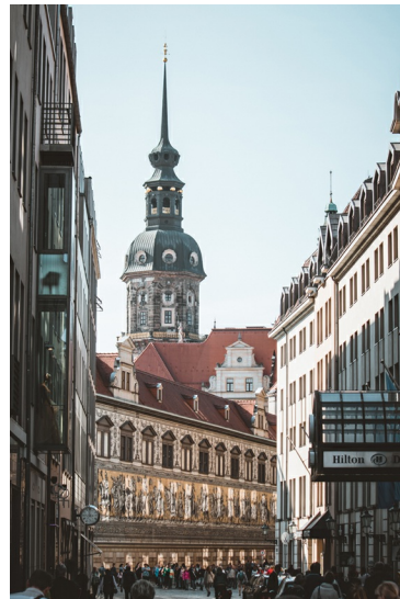
Töpferstraße met de Hausmannnturm

In de loop der eeuwen zijn er verbouwingen geweest en werden delen bijgebouwd. Dat leverde een gevarieerde verzameling bouwstijlen op. Uiteraard werd ook het Residenzschloss bij het bombardement van Dresden verwoest. De restauratie kwam echter pas in de jaren 1980 op gang en raakte na de Duitse eenwording in een stroomversnelling. Rond 2025 zouden de werkzaamheden afgerond moeten zijn. De meeste bezoekers van het Residenzschloss komen voor de schatkamers in het Neues Grünes Gewölbe en Historisches Grünes Gewölbe waar zo'n 4500 voorwerpen tentoongesteld worden. De naam Grünes Gewölbe ("groene gewelven") slaat op de boogvormige groengeschilderde ruimten en wordt sinds 1586 al gebruikt. Een aantal jaar eerder liet keurvorst August van Saksen geheime opslagruimten inrichten voor zijn kostbaar-