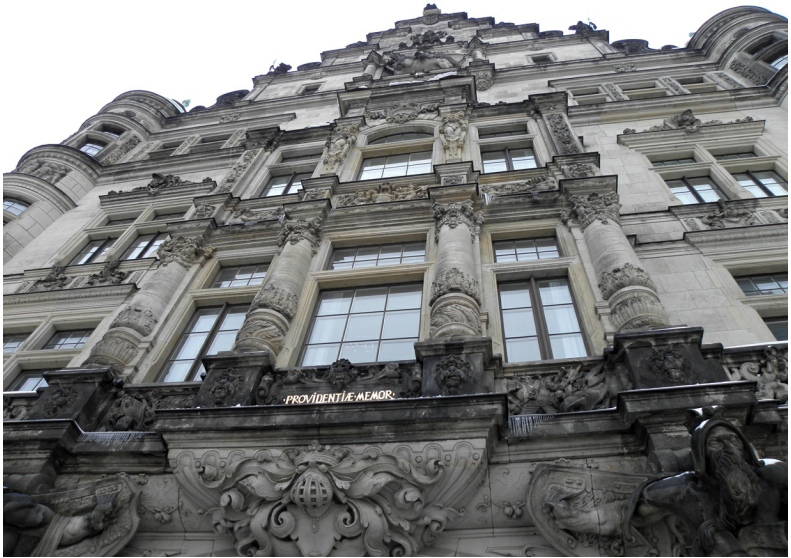
Dresden pronkstad: Georgenbau met rechts de Hausmannurturm

Daarbuiten woedde een vuurstorm. Dresden was één grote vlam. Die vlam vrat alles op wat organisch was, alles wat kon branden. De volgende dag om twaalf uur durfden ze pas naar buiten. Toen de Amerikanen en hun bewakers buiten kwamen, was de hemel zwart van de rook. De zon was een priemende speldenknop. Dresden leek nu op de maan, uitsluitend mineralen. De stenen waren heet. Iedereen in de omgeving was dood.