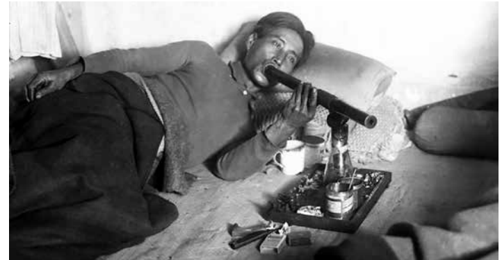
Een opiumschuiver in Rotterdam, 1922

Tegenwerking van opiumhandel werd zelfs streng bestraft. Het was dan ook niet vreemd dat van Turkse zijde in de jaren twintig 'geen enkele medewerking viel te verwachten bij de strijd tegen de internationale illegale opiumhandel,' aldus