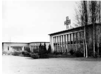
De Nederlandse Fabriek van Pharmaceutisch Chemische Producten in Apeldoorn.

enkele internationale overeenkomst over handel en productie van verdovende middelen ondertekend. Het land werd ook pas in 1932 lid van de Volkenbond.