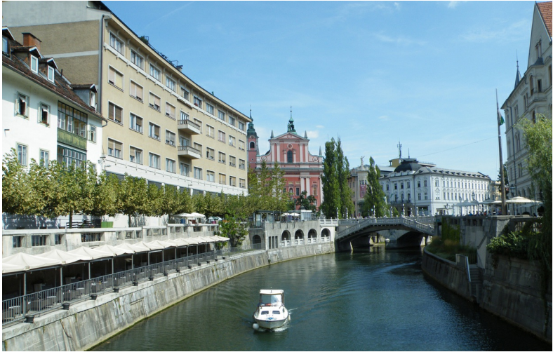
De rivier de Ljubljanica stroomt dwars door de stad.

'Het kleine Praag' wordt Ljubljana wel genoemd en wie rondloopt door het oude centrum van de stad begrijpt deze vergelijking meteen. De vele pleinen en monumenten en de kleinschaligheid waardoor alle belangrijke bezienswaardigheden op loopafstand van elkaar liggen, maken dat je vrijwel meteen moet denken aan de grotere zus in Tsjechië. Het belangrijkste symbool van stad is de draak. Deze kom je dan ook tegen op één van de topattracties van de stad, de toren van het Ljubjanksj Grad, het kasteel dat een stad op zichzelf is. Maar ook op de Zmajski most, de Drakenbrug. De draak symboliseert voor de stedelingen van Ljubljana de macht, moed en grootsheid van de stad.