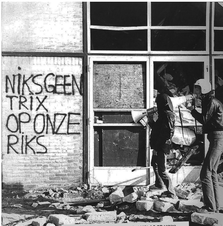
NIKS GEEN TRIX OP ONZE RIKS, OMSLAG EP VINYL, MEGAFOONS, UTRECHTSE PUNKBAND, 1985.