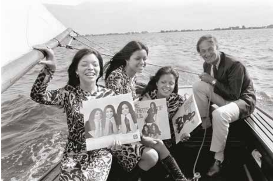
Hearts of Soul