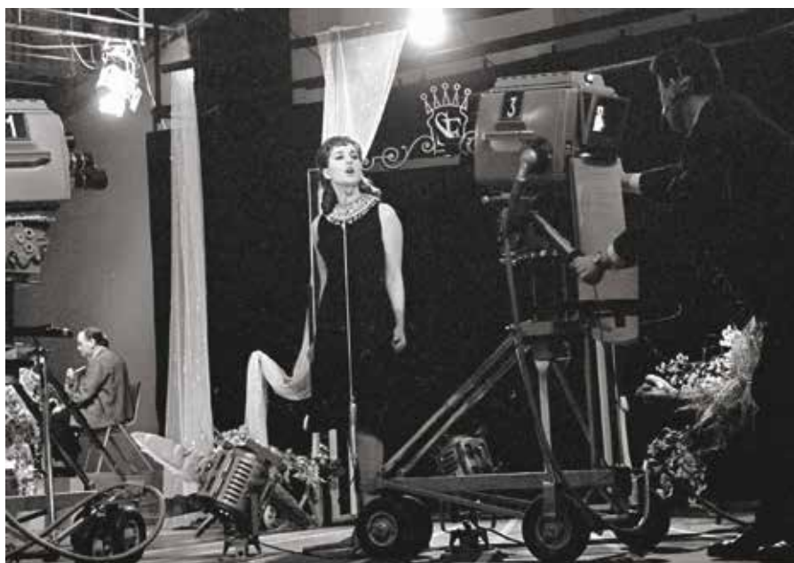
Shirley Zwerus

Niet alleen Anneke, Trea en Imca krijgen in één klap een sterrenstatus door deel te nemen aan een talentenjacht. Die wedstrijden blijken een broedplaats voor bekende namen en het hele land stikt ervan. En dan was er nog het tv-programma Nieuwe Oogst , een soort The Voice of Holland avant la lettre waar ook een jonge André van Duin zijn doorbraak aan te danken heeft. Een van de deelnemers daarvan is Liesbeth List, een jonge chansonière die niet veel later een onuitwisbare indruk weet achter te laten aan de zijde van haar grote ontdekker Ramses Shaffy. Met vertalingen van bijvoorbeeld Lennaert Nijh, Ernst van Altena en haar toenmalige partner Cees Nooteboom weet