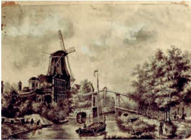
Catharijnepoort met molen De Eendracht te Utrecht, aquarel, gesigneerd W J Oppenoorth l.o., 9,5 x 13,7 cm.