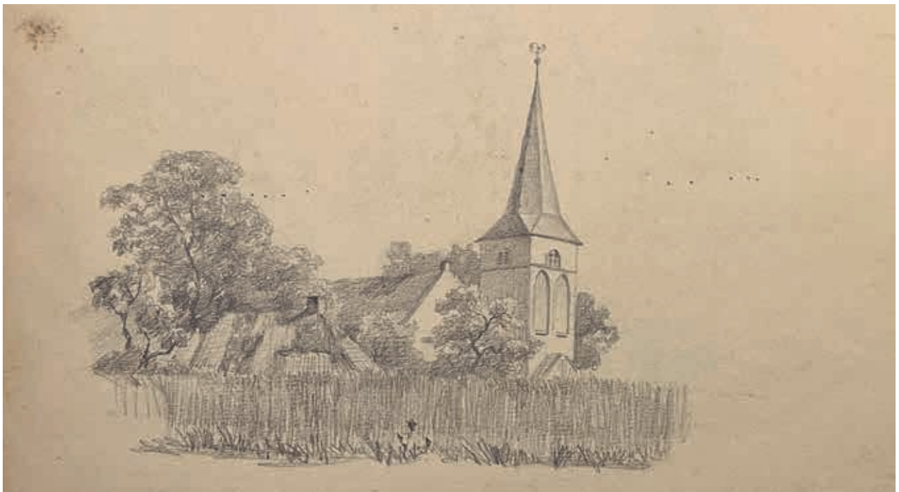
Kerk en toren van Ruurlo (1 juni 1872), potloodtekening Willem Oppenoorth.