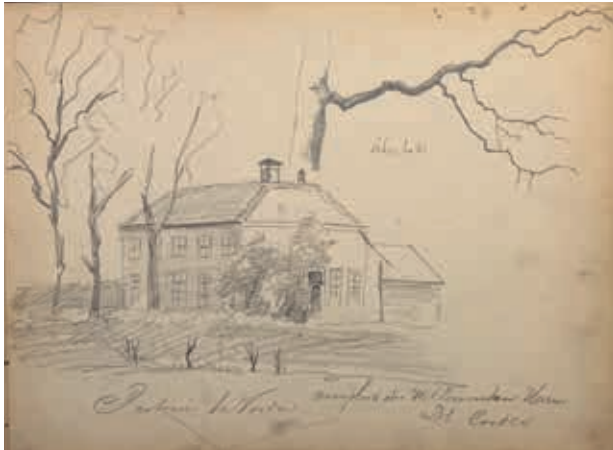
Pastorie te Vorden. Woonplaats der WelEerwaarden Heren Ds. Cordes. Eikentak, potloodschets Willem Oppenoorth.