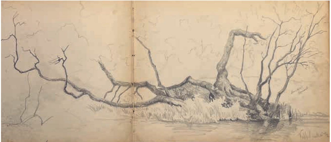
Studie van boomstronken met een opslag aan een oever. Keppel, 20 mei 1872, potloodschets Willem Oppenoorth.