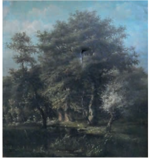
Een vijver met enige eenden en oude bomen, olieverfschilderij uit 1879.

Een vroeg schilderij met een romantische afbeelding is het olieverfschilderij met een op de grond zittend meisje en twee liggende schapen en op de achtergrond een laan in een bos.