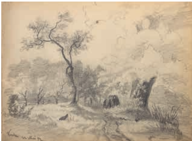
Studie landschap met bomen. Vorden, 22 mei 1872, potloodschets Willem Oppenoorth.