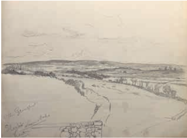
Landschap the Grange Seven Oaks Kent, potloodschets Willem Johannes Oppenoorth. COLLECTIE FAMILIE OPPENOORTH