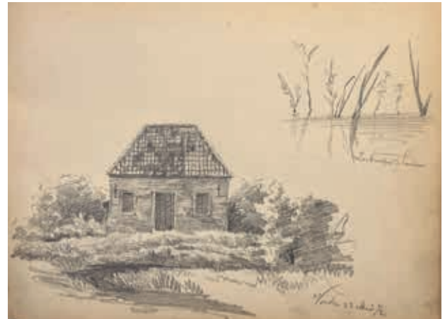
Gebouwje en zoetwaterplanten. Vorden, 23 mei 1872, potloodschets Willem Oppenoorth.