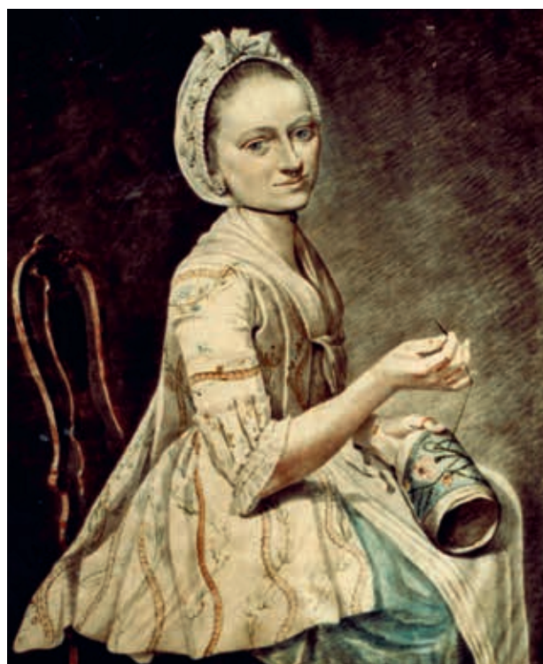
Bordurende dame, aquarel, niet gesigneerd, 21,7 x 17,5 cm. COLLECTIE FAMILIE OPPENOORTH

In het Algemeen Handelsblad (Nieuwe Amsterdamse Courant) van 8 juli 1868 staat een artikel met de kop 'Academisch Onderwijs. Teeken- en schilderschool'. Deze was gevestigd in Amsterdam. Eerst