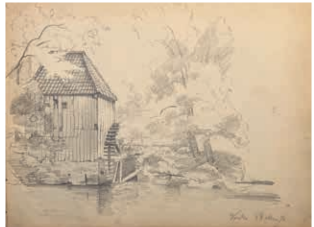
Watermolen Baakse Beek. Vorden, 28 mei 1872, potloodtekening Willem Oppenoorth.