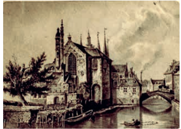
Stadsgezicht met stenen brug, aquarel, gesigneerd W J (O) r.o., 9,5 x 13,6 cm. COLLECTIE FAMILIE OPPENOORTH