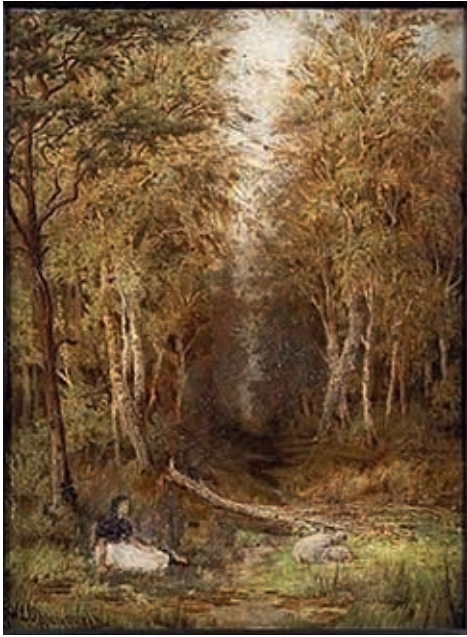
Zittend meisje met twee schapen voor een boslaan, olieverf op doek, gesigneerd W.J. Oppenoorth l.o., 41 x 31 cm.

COLLECTIE MARCEL DIEDERIKS B.V. KUNSTVEILINGEN DEN HAAG (1985), HISTORIC ATLANTA ANTIQUE ESTATE AUCTION USA (2008), SOJOURN, MUTUAL ART, USA (2014)