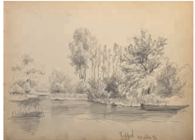
Oever met bomen en een bootje. Keppel, 20 mei 1872, potloodschets Willem Oppenoorth.