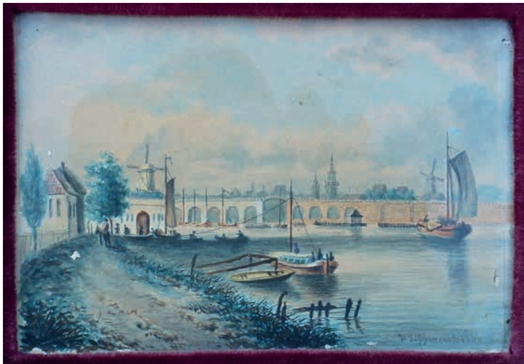
Hoge Sluis te Amsterdam, aquarel, gesigneerd W J Oppenoorth 1866 r.o., binnenmaat 11 x 16 cm, buitenmaat 22 x 27 cm. COLLECTIE FAMILIE OPPENOORTH