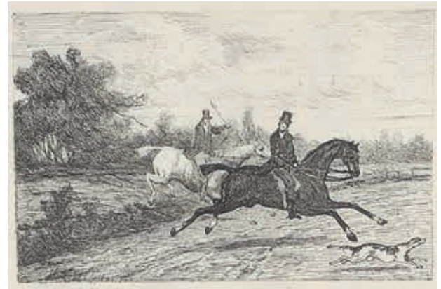
Twee heren aan het jachtrijden ets gesigneerd Willem Oppenoorth l.o.

In 1879 verschijnt van de hand van L.F. Maas Geesteranus, Lid der Nederlandsche Jacht-Vereeniging 'Nimrod', het boek Denkbeelden over Terrein-Rijden in verband met Jacht- en Jachtrijden , met daarin 'eene ets van Willem Oppenoorth'. Het is een uitgave van G.B. van Goor Zonen te Gouda.