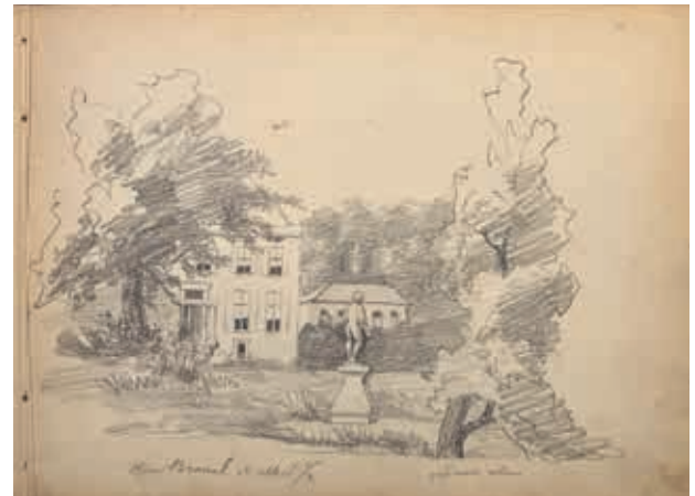
Vorden. Den Bramel, 25 mei 1872, grijsrode steen.