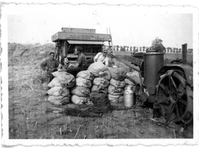
Dorsmachine van het loonbedrijf van 'Weduwe P. van IJzendoorn en zonen'. In het midden Piets moeder die opkijkt naar Piets vader. Jaartal onbekend.