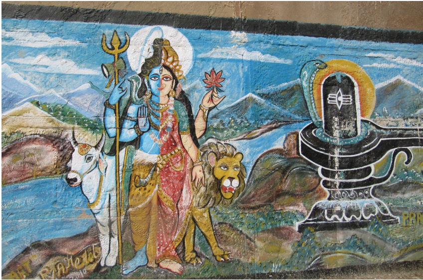
Afb. 3 'Androgyne god Shiva en Parvati', muurschildering bij de Ghats Varanasi (Benares), India. Eigen foto 2012. De linkerhelft, vanuit de kijker gezien, is de god Shiva met zijn bekende attributen: de drietand van macht, de hoorn en zijn rijdier de witte stier. Hij heeft twee rechterarmen (een voor de macht en een voor het zegenen van de mensen) en een enkel been. De rechterhelft is van zijn vrouw Parvati met de kroon, de lotus (liefde en verlichting) en haar rijdier de leeuw. De leeuw wordt meestal afgebeeld bij Shiva's andere vrouwelijke kant, de vreeswekkende godin Durga, die alle demonen kan verjagen. Zij rijdt op een leeuw of een tijger. Naast de androgyne god staat de lingam (fallus) van Shiva in de yoni (vulva) van Parvati afgebeeld: symbool voor versmelting en voor het overstijgen van de tegenpolen of tegenstellingen. Rond de lingam van Shiva zien we zijn symbool van geestelijke transformatie en kracht: de cobra. Deze slang duidt ook op de goddelijke kundalini-kracht. De zon staat achter de lingam en de yoni en duidt de verlichting aan. De versmelting levert een eenheid op, maar de delen blijven herkenbaar en eigen.

samenwerking tussen beide partners en de kracht van de bundeling van energieën.