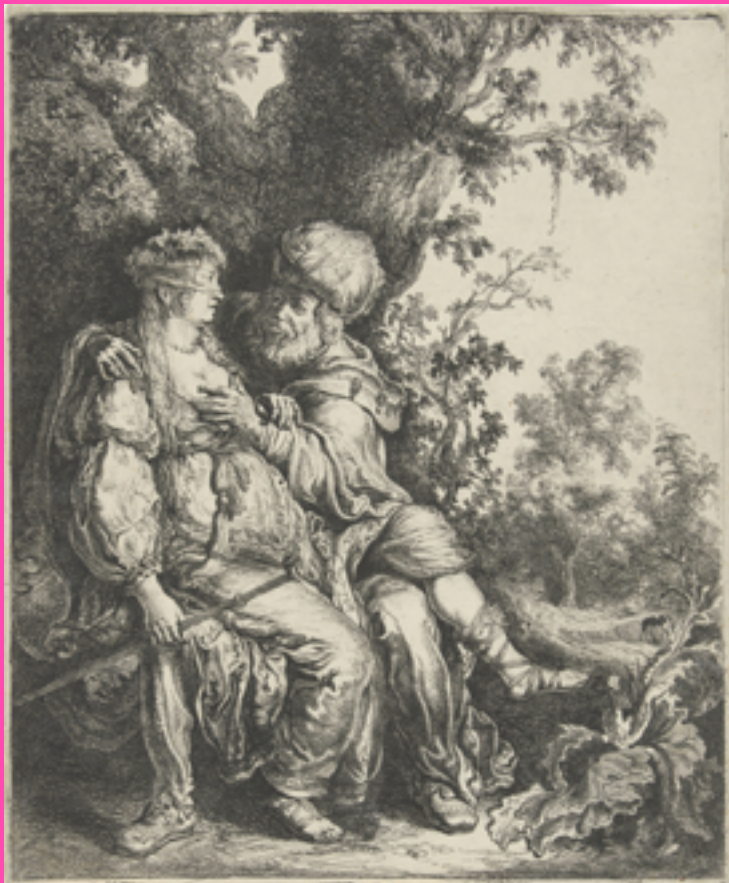
Juda en Tamar , Pieter Lastman / Rijksmuseum, Amsterdam