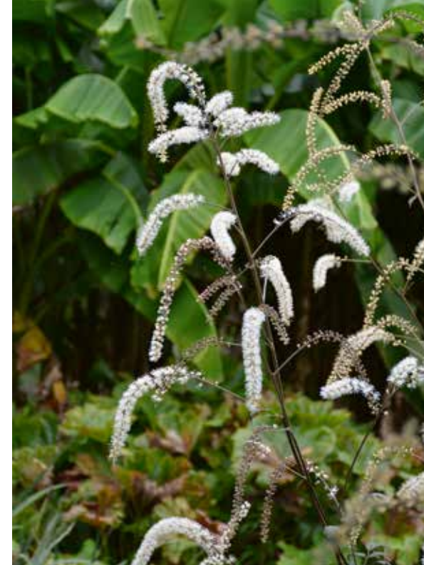
▲ Actaea racemosa 'Queen of Sheba'

De doorbraak voor de zilverkaars kwam met de bruinbladige cultivars van Actaea . 'Brunette' bijvoorbeeld heeft de weg gebaand voor veel meer bruinbladige cultivars, waarvan ik de 'Chocoholic' op zijn minst de leukste cultivarnaam vind hebben. Maar er zijn nog veel meer mooie zilverkaarsen, maar dan met groen blad. De witte vruchten van Actaea pachypoda zijn een feest in de herfsttuin. De elegante bloemen van de 'Queen of Sheba' die bijna manshoog kan worden en de vriendelijk roze bloemen van de 'Pink Spike' - er is genoeg om je over