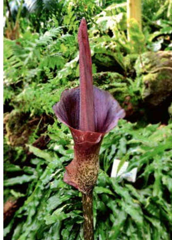
▲ Amorphophallus konjac

Voodooolie is de ook vaak gebruikte Nederlandse naam voor dit knolgewas. Deze naam past ook goed bij het exotische uiterlijk van deze plant. Laat in het voorjaar verschijnen de bladeren, maar al daarvóór is de bloem boven