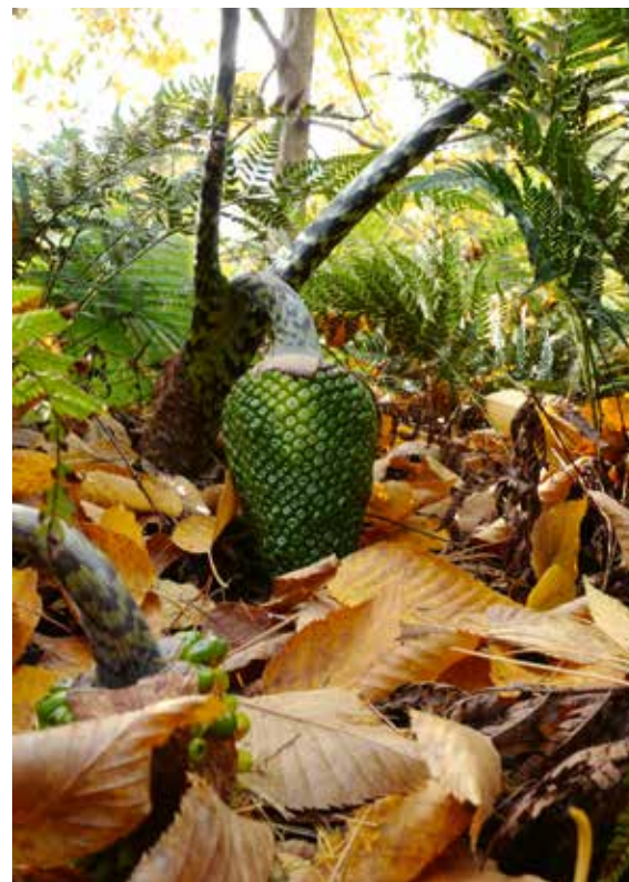
◀ Arisaema taiwanense

Een tegendraadse tuinplant uit de familie van de aronskelken. Hele tijden van het jaar kan de cobralielie uit het oog verdwenen zijn om dan plotseling weer op te duiken met decoratief blad. Ook fraai zijn de vruchtkolven die in het najaar verschijnen. Ze beginnen vaak groen, maar kunnen mooi doorkleuren. Het is een plantengeslacht dat niet zo geschikt is voor de beginnende tuinier. De cobralielie kan soms maar een enkel blad per jaar produceren, de bloemen bloeien