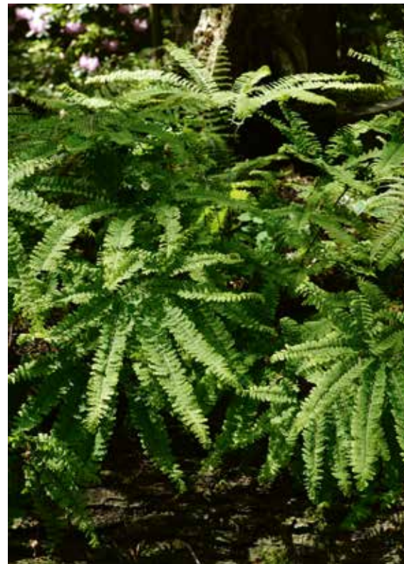
◀ Adiantum pedatum var. Aleuticum

De wetenschappelijke naam van deze fijnzinnige bosvaren is afgeleid van het Griekse woord 'adi-