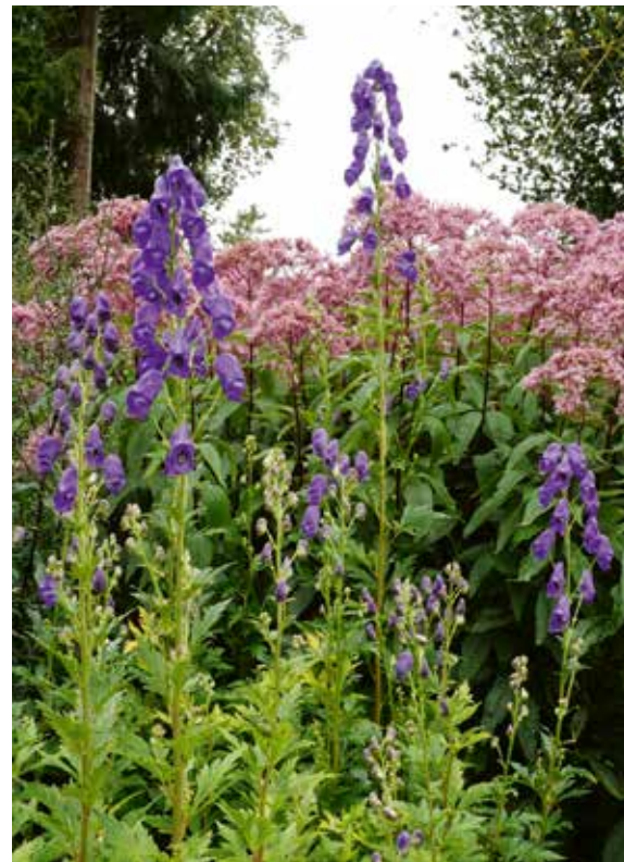
▼ Aconitum carmichaelii 'Arendsii'

De late bloeitijd, in de nazomer, van de bekende Aconitum carmichaelii 'Arendsii', misschien wel de meest gebruikte monnikskap in de bostuin, is niet maatgevend voor alle soorten. Vele bloeien al eerder in het jaar. De meeste monnikskappen bloeien met blauwe bloemen, maar ik heb ook wel een zwak voor de ivoorwitte Aconitum septentrionale 'Ivorine' of de sierlijke, bleekgele Aconitum vulparia . De bladeren zijn diep ingesneden en dragen bij aan de sierwaarde. Deze planten hebben moeite met extreem droge grond. Zorg dus voor voldoende humusrijke grond, zodat het water beter gebufferd wordt.