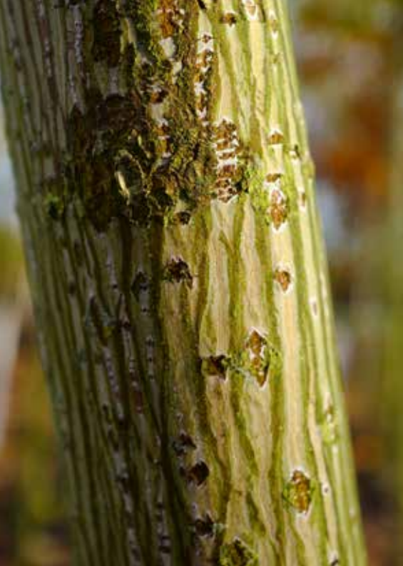
▲ Acer rufinerve