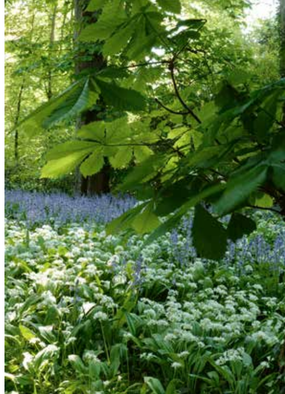
▲ Allium ursinum

De uienfamilie bestaat vooral uit zanaanbidders, maar gelukkig zijn er ook uitjes die van een uitje naar het bos houden, zo schreef ik in mijn vorige schaduwplantenboek. Wat een grapjas. Maar het is waar, ik ben dol op deze bolgewassen en ben dan ook blij dat er bosuien bestaan. Met afstand de bekendste van de schaduwminnende uien is Allium ursinum , de daslook. Een supersuccesvolle plant kan het zijn; je hele schaduwhoek kan er zomaar mee volgroeien. Voor sommige tuiniers, zeker voor degenen die niet van de uienlucht houden, is dat een reden om daslook te mijden. Minder bekend zijn Allium sicutum subsp. bulgaricum (vroeger Nectaroscordum )