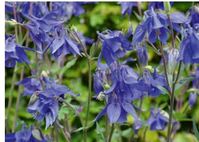
▲ Aquilegia vulgaris

Akelei is een fantastische plant voor de loszinnige tuinier. De plant gedraagt zich namelijk nogal losjes. Doordat akeleien zich nogal gemakkelijk uitzaaien, komen ze altijd op een onverwachte plek in je tuin weer op, ook tussen de tegels... Dat is een voordeel en nadeel tegelijkertijd. Je tuin wordt opgesierd door de elegante bloemen die zich heerlijk tussen de andere planten door weven, maar verwacht niet dat je perkje met akeleien er volgend jaar nog net zo leuk bij staat als het jaar daarvoor. Strooi-goed is het dus. Er zijn veel selecties