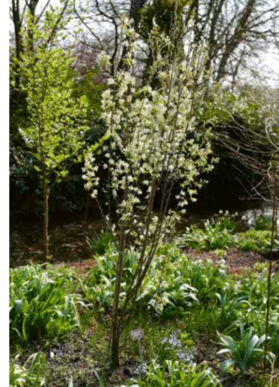
▲ Amelanchier canadensis 'Glenform' (Rainbow Pillar)

de grond gekomen. Het is een plant uit de familie van de aronskelken, een clubje dat niet bekendstaat om zijn heerlijke bloesemgeuren. Dat geldt ook voor de konjak. De geslachtsnaam Amorphophallus is zo mogelijk nog minder vleierend. Vormeloze penis is de letterlijke vertaling... De planten vormen meestal maar één of enkele bladeren, die handvormig zijn en aan een lange bladsteel zitten. Het is zeker een interessante plant, al was het maar omdat de vruchtkolven veel sierwaarde hebben. Maar dan moeten de stinkbloemen wel eerst bestoven worden, misschien een leuk klusje voor een mestkever?