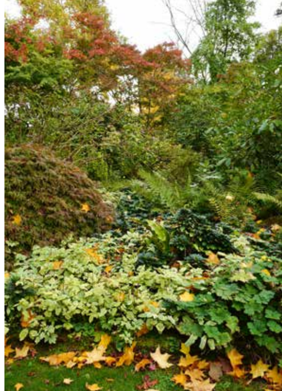
▲ Aegopodium podagraria 'Variegatum'

antos', dat 'niet nat wordend' betekent. De bladeren van deze varen nemen namelijk geen water op, ook niet als je ze onder water houdt; ze blijven droog. Er zijn serieus veel Adiantum-soorten, ongeveer 200, maar verreweg de meeste kunnen in ons klimaat niet buiten. De bekendste tuinsoort is Adiantum pedatum. Hiervan is ook een selectie met een gegolfde bladrand, 'Imbricatum'. Het zijn verrassend sterke varens, ondanks hun wat fragiele uiterlijk. Ze staan bij voorkeur op een windluw plekje. In de volle wind beschadigt het blad snel en wordt dan bruin aan de randen. Hoefijzervaren of venushaar is niet wintergroen, maar sterft in de vroege winter af en komt dan in het voorjaar weer op.