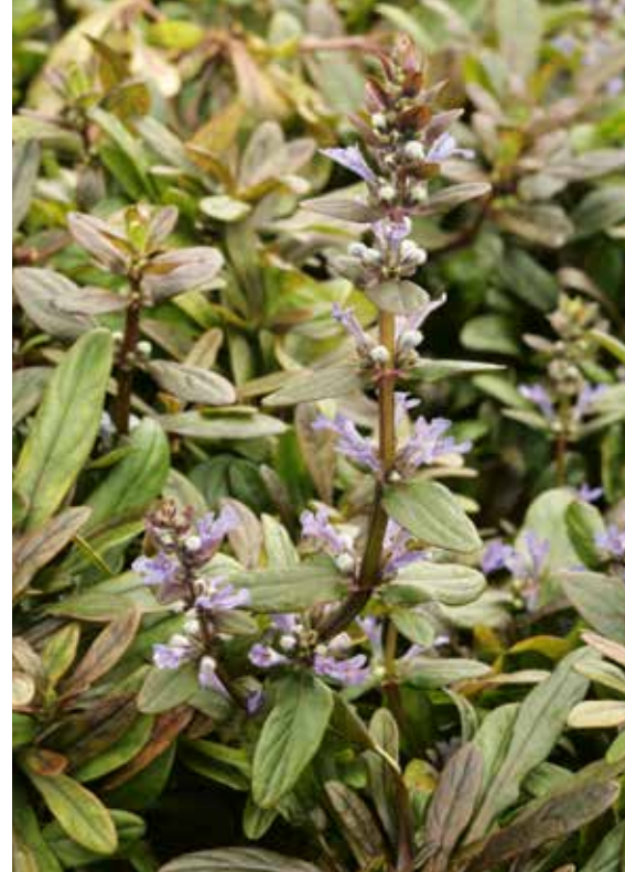
▲ Ajuga tenorii 'Valfredda' (Chocolate Chip)

Het zal ongetwijfeld aan mij liggen, maar ik ben niet altijd succesvol met het toepassen van zene-