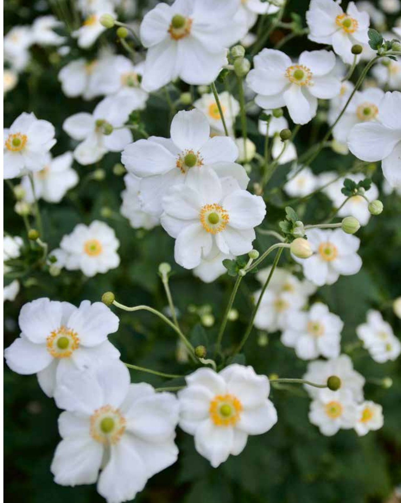
► Anemone hybrida 'Honorine Jobert'