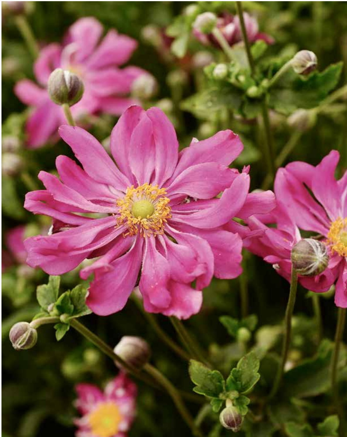
▲ Anemone hupehensis 'Prinz Heinrich'