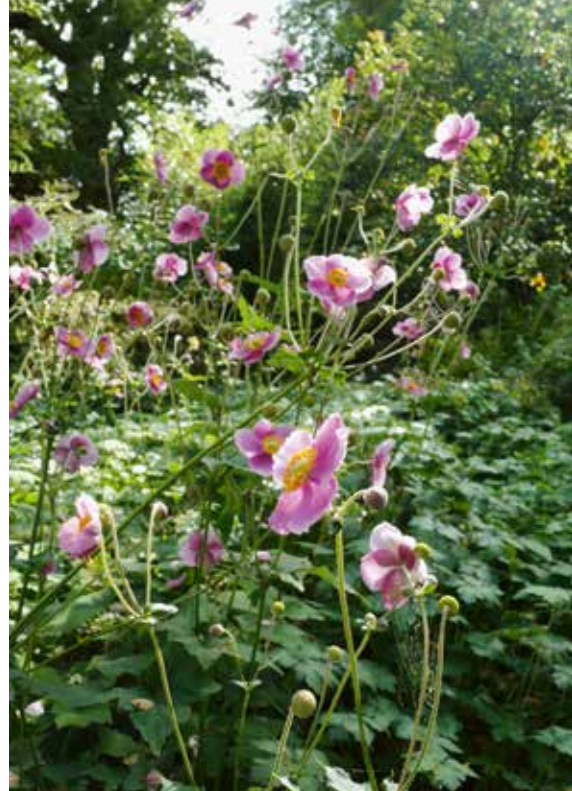
▲ Anemone hybrida 'Hadspen Abundance'

De vroeg in het voorjaar bloeiende bosanemoontjes in de tuin zijn heel verschillend van de flinke stoere herfstanemonen. Zo verschillend dat je ze bijna tot verschillende plantengeslachten zou willen maken. Anemone blanda, Anemone nemorosa en Anemone ranunculoides zijn de bekendste soorten van de vroege voorjaarsbloeiers. Kleine sierlijke plantjes die je vaak als bolletjes plant en die in een lekkere bosgrond rustig gaan verwilderen. Je hebt er geen kind aan, want in de zomer trekken ze zich vaak al weer terug om plaats te maken voor de wat later in het jaar actief wordende vaste planten. Via de al weer iets flinkere Anemone x lesseri en Anemone silvestris bewegen we ons